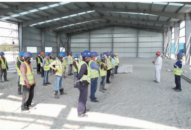
孟加拉国博杜项目对员工进行防疫交底