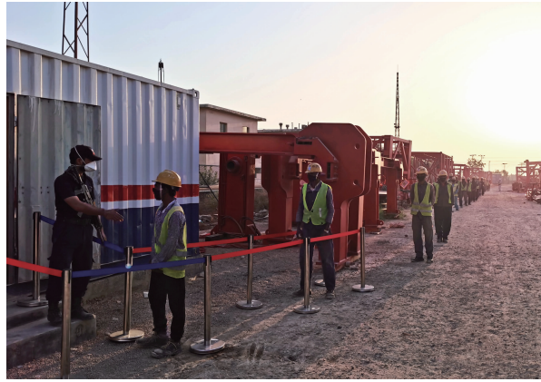
巴基斯坦贾姆肖罗现场全力做好疫情防控

当前,内部反弹有风险,外部形势在变化,疫情防控常态化将成为公司不得不面对的一次大考。公司全体员工将用责任筑牢“防疫墙”,用关爱织密“防疫网”,全力以赴、攻坚克难,在这场大考中交出满意答卷。(温晖)